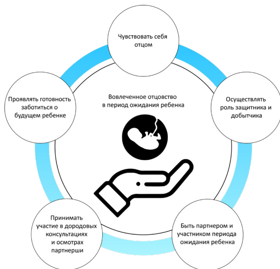
Рис 1. Структурный анализ компонентов вовлеченного отцовства в период ожидания ребенка (Alvarenga et al., 2024).

Посещение родительских курсов, интерес к литературе, отражающей вопросы развития и воспитания детей, являются маркерами готовности проявлять заботу к новорожденному и уход за ним (Шакаримов, 2020).