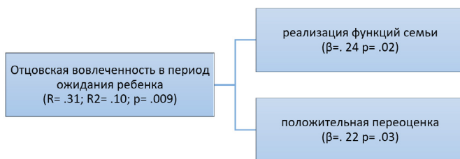
Рис 2. Данные регрессионного анализа факторов, предсказывающих отцовскую вовлеченность в период ожидания ребенка

Линейный регрессионный анализ позволил выявить два фактора, которые детерминируют меру вовлеченности мужчин в беременность. Установлено, что значимыми предикторами вовлеченности отцов в беременность выступает успешная реализация мужчиной собственных функций в семье и его усилия по созданию положительного смысла текущих ситуаций (положительная переоценка) (см. Рис. 2).