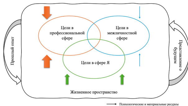
Рис. 1. Динамический процесс постановки и реализации целей личности

Представленная схема (см. рис. 1) наглядно иллюстрирует системность и целостность жизненного пространства, а также демонстрирует, каким образом в его структуре проявляются содержание и структурные характеристики жизненных целей. Цветные стрелки, направленные на три ключевые сферы жизнедеятельности, символизируют притягательность и напряженность соответствующих целей для индивида, побуждающих человека инвестировать психологические и материальные ресурсы для их достижения. Толщина стрелок отражает субъективную значимость той или иной цели: чем толще стрелка, тем выше значимость цели для личности, а значит, тем больше усилий она готова вкладывать в ее реализацию. Кроме того, данная схема подчеркивает временную структуру жизненных целей. Личный опыт прошлого (отраженный в левой белой стрелке) и устремления в будущее (правая белая стрелка) оказывают совместное влияние на конструирование актуальных целей. Такая интеграция временных измерений позволяет целям не только отражать намерения текущего момента, но и одновременно включать в себя элементы прошлого опыта и будущих ожиданий, тем самым раскрывая динамическую и развивающуюся природу целевой структуры жизненного пространства.