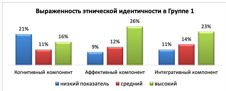
Рис. 10. Результаты по выраженности этнической идентичности у группы 1 по методике, измеряющей выраженность этнической идентичности (Дж. Финни).

В группе 2 намного больше респондентов с высоким показателем аффективного компонента этнической идентичности (35%), в группе 1 этот показатель выражен чуть меньше (26%) (см. Рис. 10 и 11).