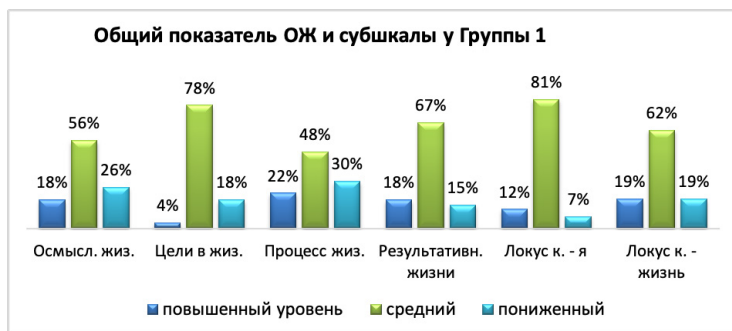
Рис. 7. Общий показатель осмысленности жизни и показатели субшкал у группы 1 по методике: Тест смысложизненные ориентации (методика СЖО), Д. А. Леонтьев.

в сравнении с тем же показателем в группе 2 (3%). Также в группе 1 значительно больше респондентов с повышенным уровнем результативности жизни (18%) в сравнении с группой 2 (3%)