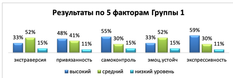
Рис. 2. Результаты по пяти факторам опросника группы 1.

из группы 1, 26% из группы 2), у 56% респондентов – нейтральная валентность идентичности (33% из группы 1, 23% из группы 2), у 4% респондентов – негативная (2% из группы 1, 2% из группы 2), у 2% респондентов завышенная валентность идентичности (2% из группы 2) (см. Рис. 4).