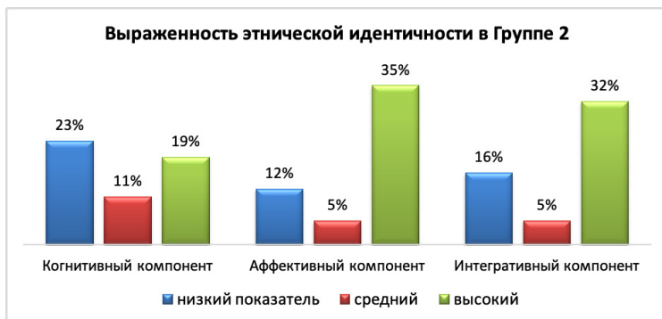
Рис. 11. Результаты по выраженности этнической идентичности у группы 2 по методике, измеряющей выраженность этнической идентичности (Дж. Финни).

На вопрос: «Изменилось ли мое Я и мое поведение в условиях пандемии?» – 46% респондентов ответили отрицательно, 40% респондентов – положительно, и 14% – затруднялись ответить (см. Рис. 12).