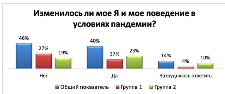
Рис. 12. Результаты ответов на вопрос авторской анкеты с разделением на группы.

Те, кто ответили положительно, отмечали ограничения в сфере досуга и развлечений, потерю интереса к прошлым увлечениям, «открытие» для себя одиночных прогулок, избирательность в общении, появилась настороженность, появилось время для себя, возможность «замедлиться», планы отменились, у некоторых пострадало качество образования, некоторые стали более замкнутыми, многие отмечают ухудшение самочувствия, пришло ощущение отсутствия границ благодаря обнаружению новых виртуальных возможностей, люди начали специально уделять время физической активности.