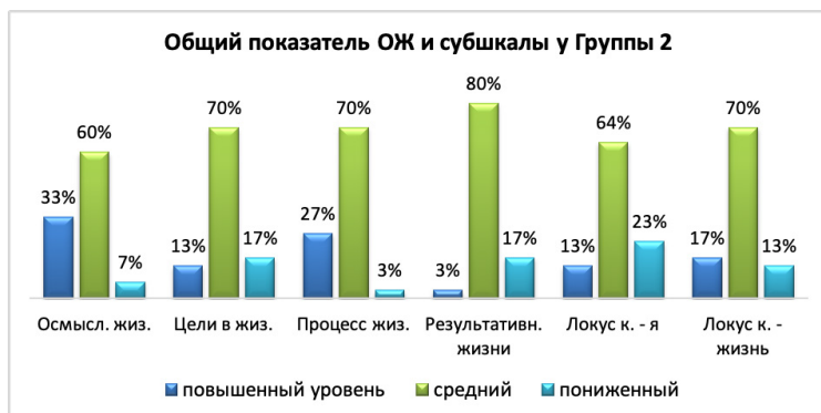
Рис. 8. Общий показатель осмысленности жизни и показатели субшкал у группы 2 по методике: Тест смысложизненные ориентации (методика СЖО), Д.А. Леонтьев.

По четвертой методике получены следующие данные: по когнитивному компоненту этнической идентичности у 44% респондентов низкий и пониженный уровень, у 21% – средний, у 35% – повышенный и высокий. По аффективному компоненту у 21% респондентов низкий и пониженный уровень, у 18% – средний,