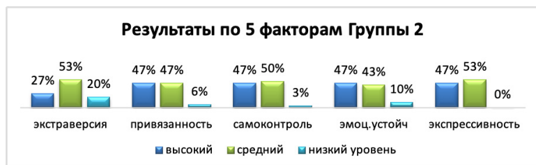
Рис. 3. Результаты по пяти факторам опросника группы 2.