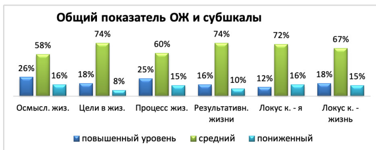
Рис. 6. Общий показатель осмысленности жизни и показатели субшкал по методике – Тест смысложизненные ориентации (методика СЖО), Д.А. Леонтьев.

В результате проведения третьей методики мы выявили, что по всем шкалам у выборки преобладает средний показатель (см. Рис. 6).