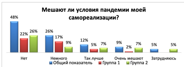
Рис. 13. Результаты ответов на вопрос авторской анкеты с разделением на группы.

Навопрос: «Мешают ли условия пандемии моей самореализации?» – 48% респондентов ответили отрицательно, 26% – эти условия немного мешают, 12% респондентов отметили, что так даже лучше, 9% респондентов – условия пандемии очень мешают, и 5% затруднялись ответить (см. Рис. 13).