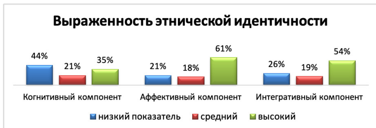
Рис. 9. Результаты по выраженности этнической идентичности по методике, измеряющей выраженность этнической идентичности (Дж. Финни).

у 61% – повышенный и высокий. По интегративному показателю этнической идентичности у 26% респондентов низкий и пониженный уровень, у 19% – средний, у 54% – повышенный и высокий показатель (см. Рис. 9).