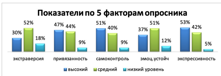
Рис. 1. Общие результаты по пяти факторам опросника.

экстравертированность, у 18% – интравертированность. По шкале привязанность-обособленность у некоторых респондентов (47%) преобладает привязанность. Данные шкалы самоконтроль-импульсивность показали, что большинство респондентов (51%) обладают высоким самоконтролем поведения. По шкале эмоциональная устойчивость-эмоциональная неустойчивость большинство (51%) имеют средний показатель. Также у 53% респондентов высокий уровень экспрессивности (см. Рис. 1).